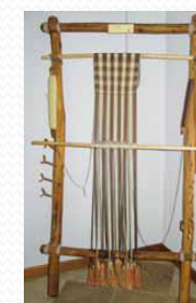
Telaio Neolitico Ricostruzione sperimentale

Il Museo Laboratorio della Preistoria di Vaie espone le proprie ricostruzioni sperimentali e una collezione tattile. Offrendo uno spaccato di vita quotidiana nella Preistoria, permette di approfondire la conoscenza di tecnologie e materiali della storia dell'Uomo. Il Percorso Archeologico, con il Riparo sotto Roccia e la "Baità" (nei pressi, la capanna sperimentale), consente di scoprire il luogo in cui verosimilmente sorgeva l'insediamento del IV millennio. Sede di importanti ritrovamenti archeologici, il Percorso offre altresì molteplici aspetti geologici e naturalistici.