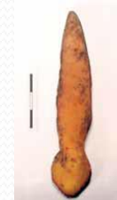
Navetta per tessitura periodo Neolitico

Il Museo Laboratorio della Preistoria di Vaie espone le proprie ricostruzioni sperimentali e una collezione tattile. Offrendo uno spaccato di vita quotidiana nella Preistoria, permette di approfondire la conoscenza di tecnologie e materiali della storia dell'Uomo. Il Percorso Archeologico, con il Riparo sotto Roccia e la "Baità" (nei pressi, la capanna sperimentale), consente di scoprire il luogo in cui verosimilmente sorgeva l'insediamento del IV millennio. Sede di importanti ritrovamenti archeologici, il Percorso offre altresì molteplici aspetti geologici e naturalistici.