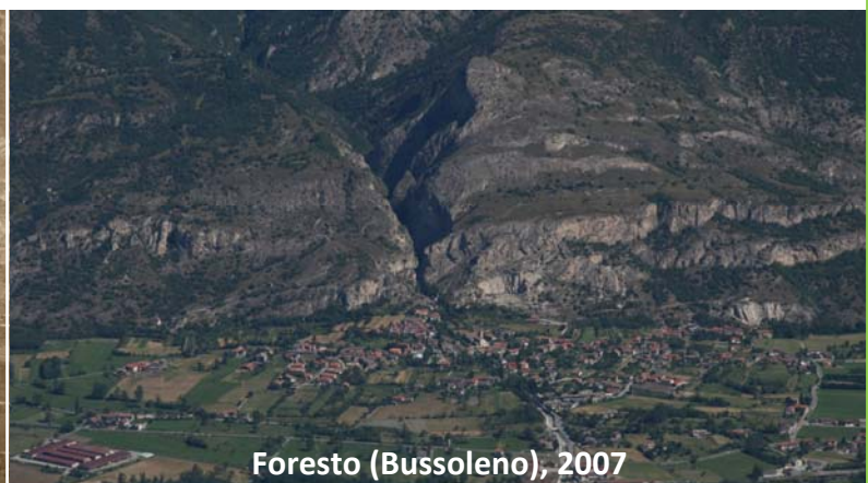
Foresto (Bussoleno), 2007