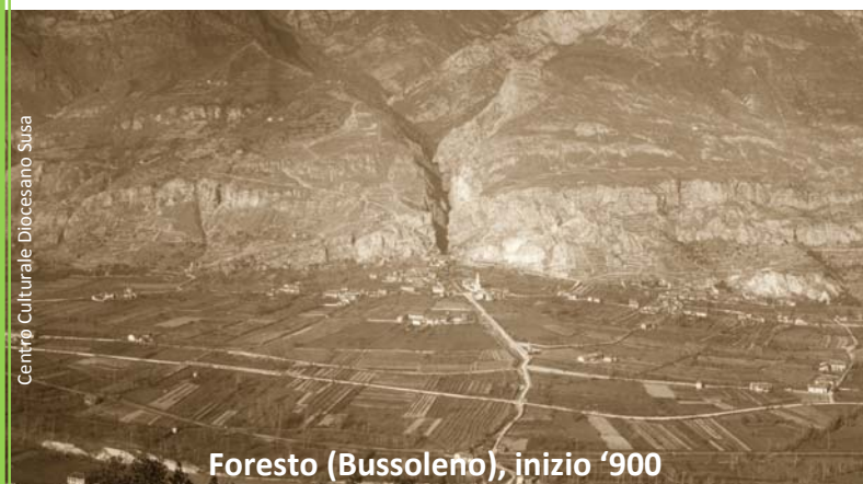
Foresto (Bussoleno), inizio '900