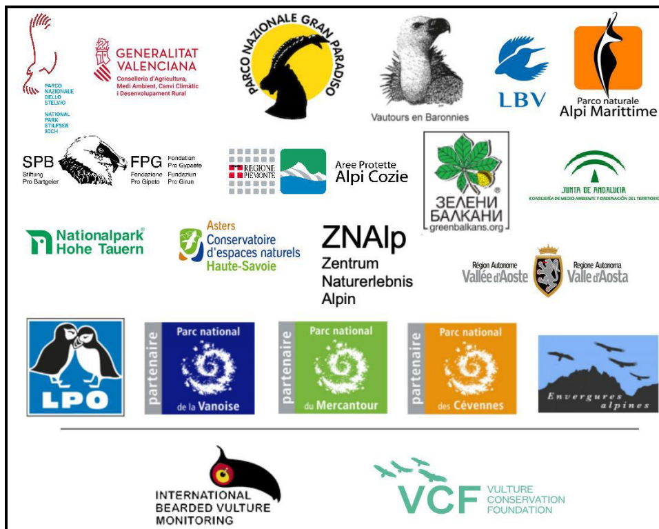
Figura 1: Enti e associazioni appartenenti alla rete internazionale IBM ( http://www.gyp-monitoring.com/ ).

Attività di monitoraggio di Avvoltoi e Rapaci alpini – Anno 2021. Relazione tecnica. Ente di gestione delle Aree protette delle Alpi Marittime. Centro di Referenza Regionale “Avvoltoi e Rapaci alpini”. Dicembre 2021. Pp: 11.