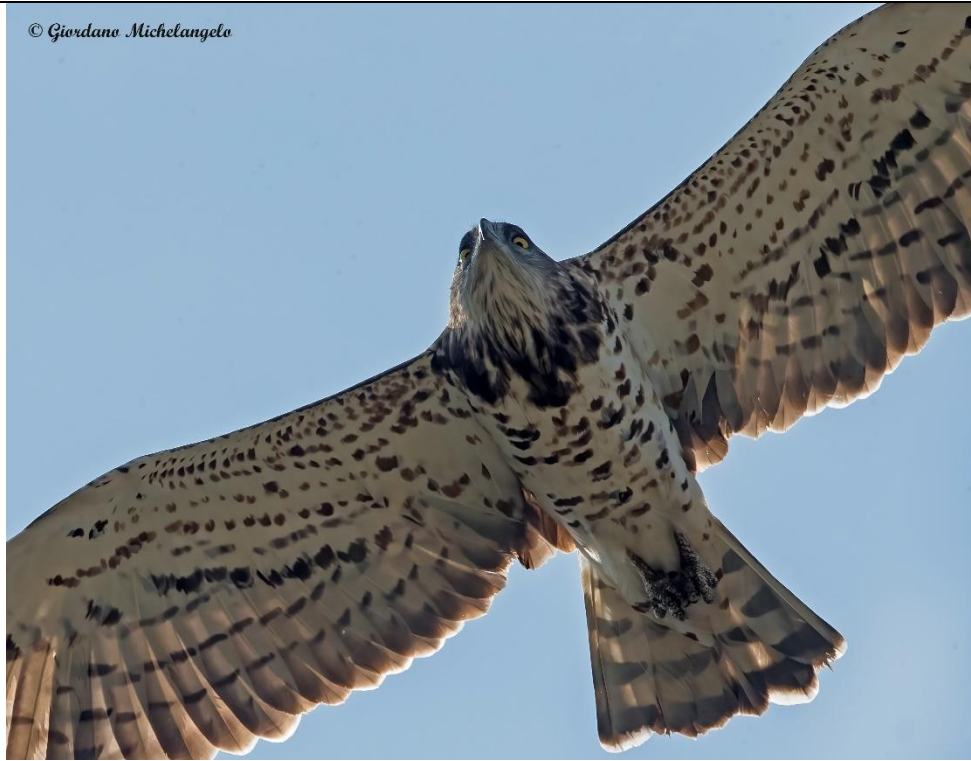
Biancone ( Circaetus gallicus )