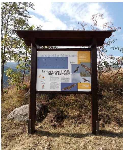
Figura 3: Bacheca installata presso il sito di osservazione di Madonna del Pino.

Inoltre, dato che quest’anno il Progetto Migrans ha compiuto 30 anni, negli ultimi giorni di agosto presso il sito di Madonna del Pino è stata posizionata una bacheca in legno con un pannello contenente foto e testi divulgativi inerenti al Progetto, realizzati dallo scrivente in collaborazione con il Settore Comunicazione dell’Ente di gestione delle Aree protette delle Alpi Marittime.