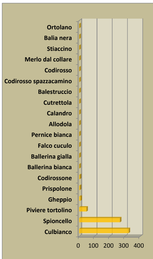
Tab. 1 Totale inanellamenti 2013-2015

Sono stati inanellati 160 uccelli, appartenenti a 9 specie, tra cui 17 esemplari di piviere tortolino che portano il totale di individui inanellati appartenenti a questa specie a 45. Il numero delle catture nel corso dei tre anni di studio è passato a 675 appartenenti a 20 specie, la tabella 1 riepiloga specie e numero di uccelli inanellati, mentre la tabella 2 indica il numero di inanellamenti e le specie per anno di studio.