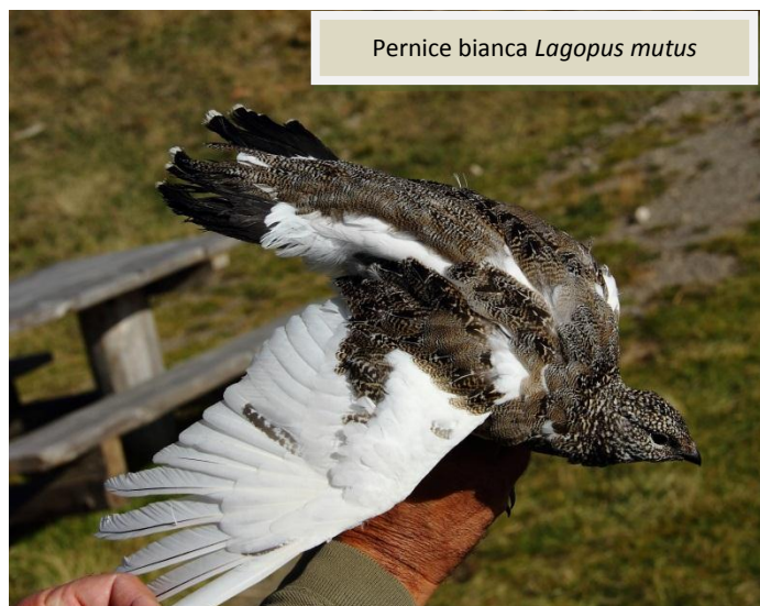
Pernice bianca Lagopus mutus