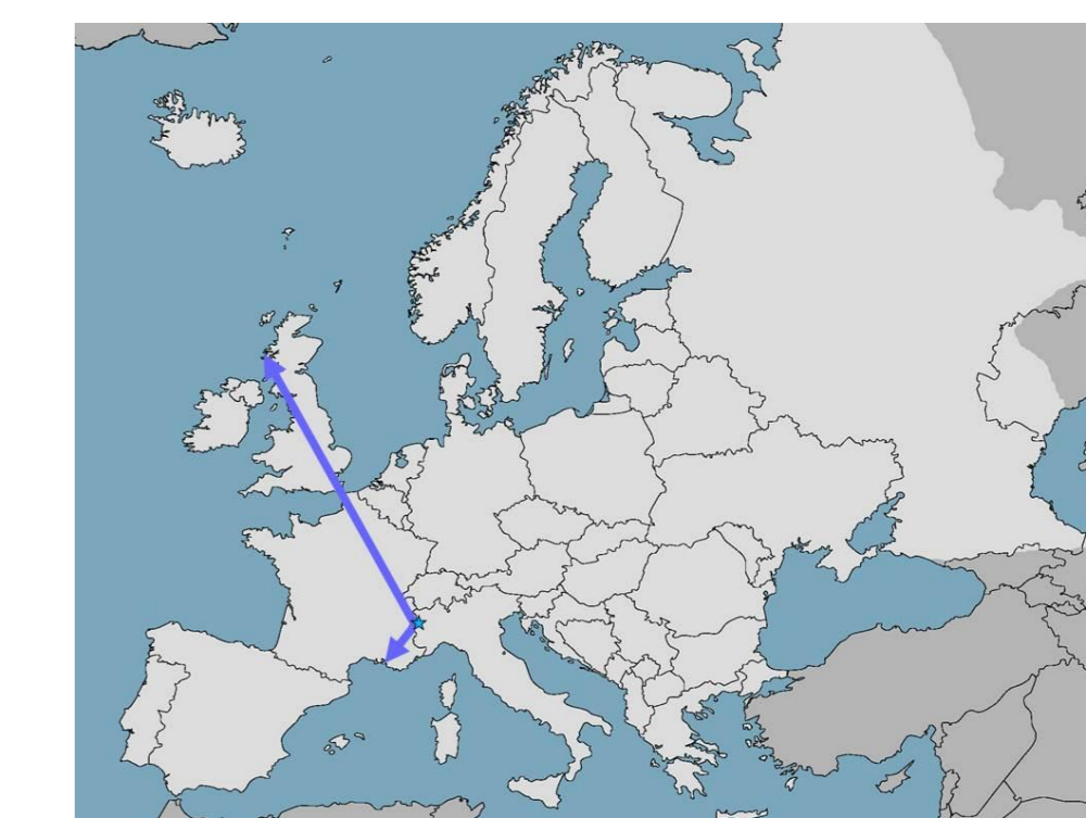
Piviere tortolino: riletture anelli colorati